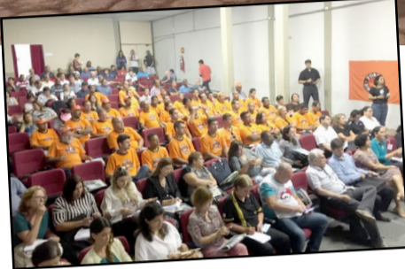
Cipeiros participam do Seminário de Saúde na Faculdade de Geologia em Ouro Preto