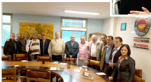
Visita no Sindicato Nacional dos Aposentados