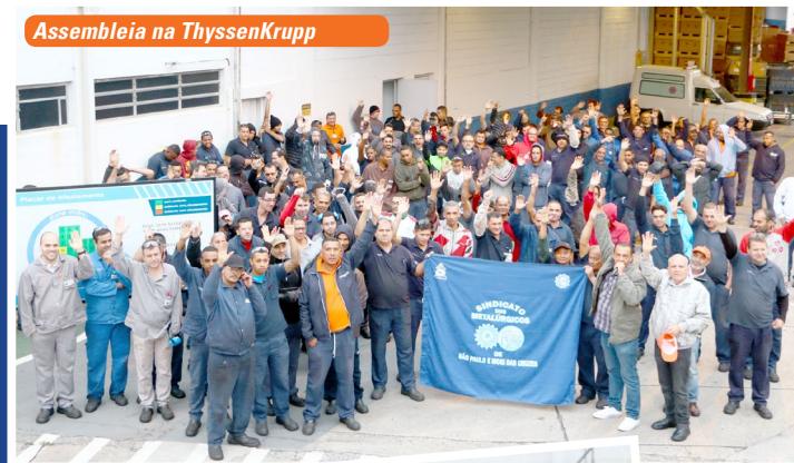
Assembleia na ThyssenKrupp