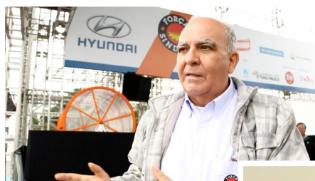
No palco do 1º de Maio na praça Campo de Bagatelle