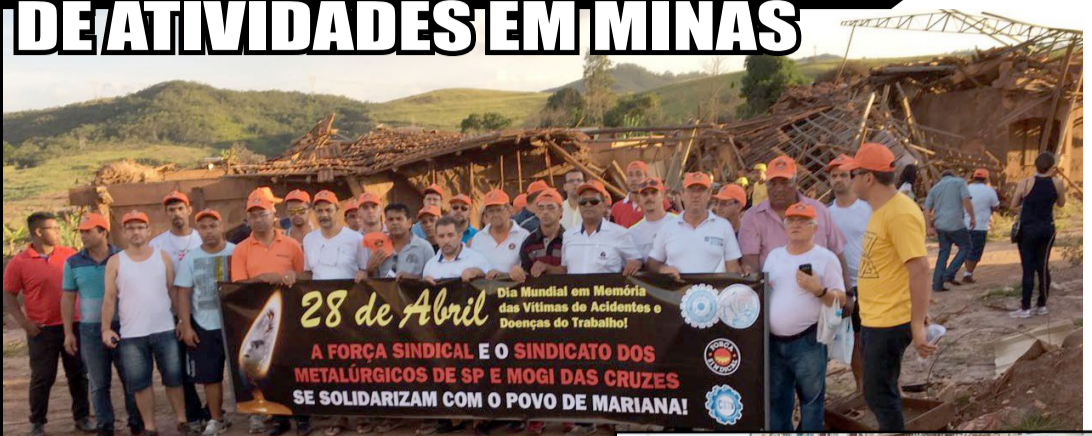
Nosso grupo de cipeiros, diretores e assessores visitou vários locais destruídos pela lama