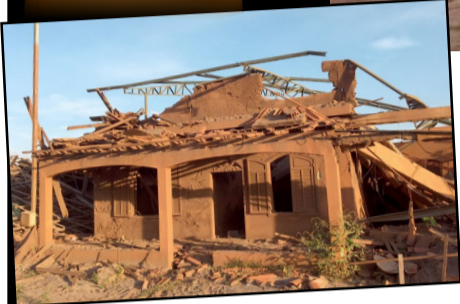
Casa destruída pela lama da barragem em Bento Rodrigues